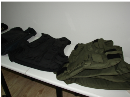
Выполнение практического задания экзамена охранников: