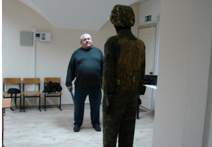
Экзамен охранника на применение наручников: